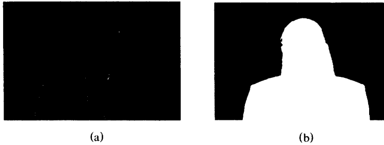
그림 3. 입력 영상(702×480) (a)Akiyo.y (b)Akiyo.a