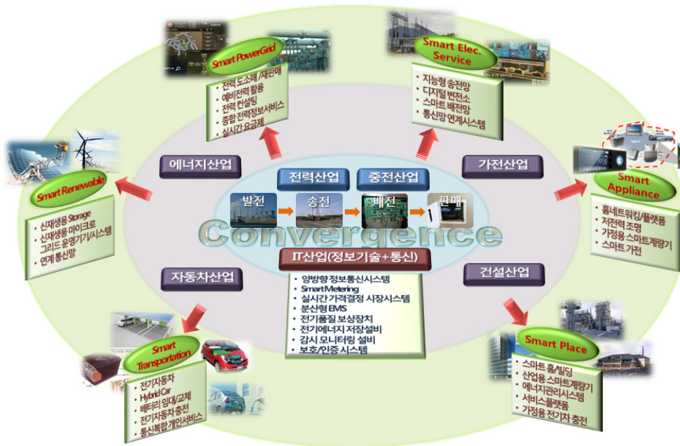
그림 2. 스마트그리드 융합에 따른 확산방향 및 파생사업

건설산업에서는 스마트가전, 스마트전력 등이 어울려 ‘Smart Place’ 사업이 활발해질 것으로 기대된다. 이는 스마트 홈이나 스마트 빌딩, 스마트 공장 등으로 대표되는데, 이러한 건축물에 효율화된 에너지관리시스템, 스마트계량기, 스마트 서비스플랫폼, 가정용 전기자동차 충전시스템 등이 접목되는 것이 바로 Smart Place 사업이다.