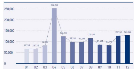
그림 1. 2013년 월 별 모바일 악성코드 접수량 Fig. 1. Monthly receipt rate of mobile malware in 2013

록 설계된 악성코드는 2014년 1분기(1월~3월) 동안 나타난 새로운 악성 어플리케이션의 99%를 차지한다. 나머지 1%는 iOS와 심비안에서 발생하였다. 이처럼 악성코드가 계속 증가하고 있으며 특히, 안드로이드 플랫폼을 대상으로 공격자들이 악성코드를 포함한 어플리케이션을 계속 배포하고 있다. 따라서 모바일 환경에서 악성코드를 탐지하는 방법에 대한 연구와 탐지 시스템 개발이 필요하다. 본 논문에서는 기계학습 분류기 중 문서 분류, 트래픽 분류에 많이 사용되는 선형 SVM(Support Vector Machine) 분류기를 적용한 악성코드 탐지 시스템을 제안한다. 제안한 시스템의 악성코드 분석 성능을 보이고, 성능 향상을 위한 feature 선정에 대해서 설명하고 feature 선정 결과 향상된 성능 결과를 보인다.